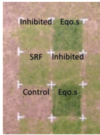
Bild 1: Drohnenaufnahme eines Abschnitts des Sommerdüngerversuchs am STRI aus der 6. Woche.

Die anfängliche Reaktion in Bezug auf die durchschnittliche Rasenfarbe war am stärksten für den gehemmten Stickstoff (Abbildung 1), aber bis zum 14. Tag zeigten alle drei Dünger eine gleichwertige Rasenreaktion. Bis zum 28. Tag war die Rasenreaktion für den mit eqo.s behandelten Rasen signifikant besser ( P < 0.01 ). Diese signifikant stärkere Reaktion blieb für eqo.s bis zur 12. Woche bestehen. Die mittlere Rasenqualität folgte einem ähnlichen Trend (Abbildung 2), wobei der gehemmte Stickstoff am 7. Tag eine stärkere Reaktion zeigte, die sich bis zum 14. Tag ausglich. Am 28. Tag zeigte die Behandlung mit eqo.s Dünger einen signifikant höheren Qualitätswert, der bis zur 12. Woche anhielt. Die NDVI-Ergebnisse zeigten ähnliche Reaktionen (Daten nicht gezeigt). Anhand von Drohnenaufnahmen des Versuchs (Bild 1) aus der 6. Versuchswoche waren die unterschiedliche Reaktion des Rasens deutlich sichtbar.