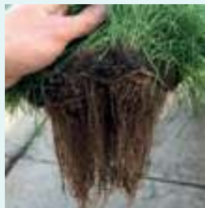
Anderes hochleistungsfähige Düngemittel

Die Ergebnisse unabhängiger Versuche belegen eine signifikant stärkere Wurzelbildung bei Verwendung der Sierrablen Plus Pearl®-Struvit-Technologie während der Rasenaussaat. Im Vergleich zu einem anderen leistungsstarken Produkt wurde eine 2,5-fach stärkere Wurzelbildung festgestellt.