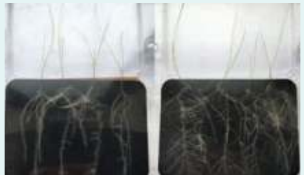
Setzlinge von Deutschem Weidelgras mit gleichwertigem NPK-Verhältnis versorgt. Links ohne SMX, rechts mit SMX

Unter Versuchsbedingungen erhöhte SMX die Gesamtwurzeloberfläche von Deutschem Weidelgras signifikant.