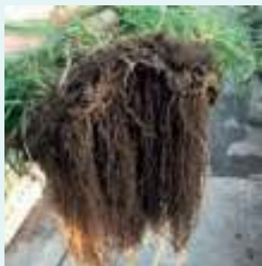
Sierrablen Plus mit Pearl®-Technologie

Die aus kommunalen und industriellen Abwässern recycelten Nährstoffe aus Struvitgranulaten (5-28-0+10Mg) der Pearl®-Technologie werden in Reaktion auf organische Säuren freigesetzt, die durch wachsende Wurzeln der Rasenpflanzen produziert werden. Die Granulate setzen ihre Nährstoffe für die Pflanzen somit bedarfsgerecht und entsprechend umweltschonend frei.